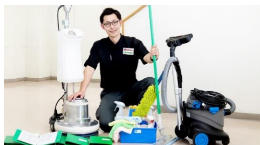
事業所向け清掃サービス

本展示会では、中小のオフィスビルをはじめ、マンション共用部等を対象にした事業所向け清掃サービスを行う「ダイオーズカバーオール」と、玄関先や入口前に敷く「マット」や「フローアーマップ」等のダストコントロール商品をはじめ、外からのウィルス・菌の持ち込みの抑制や空間除菌などを行う「環境衛生サービス」の各主力商品を展示し、賃貸住宅市場でお役に立てる商品、サービスの数々をご提案いたします。