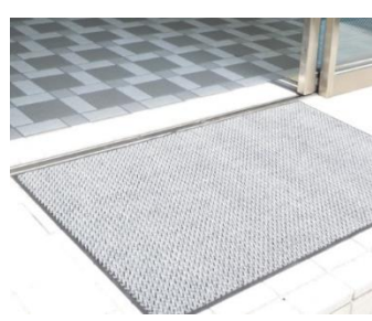
環境衛生サービス