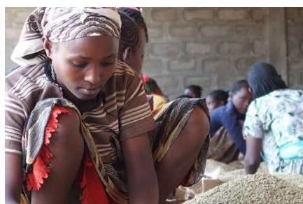
【動画】 フェアトレードとは？